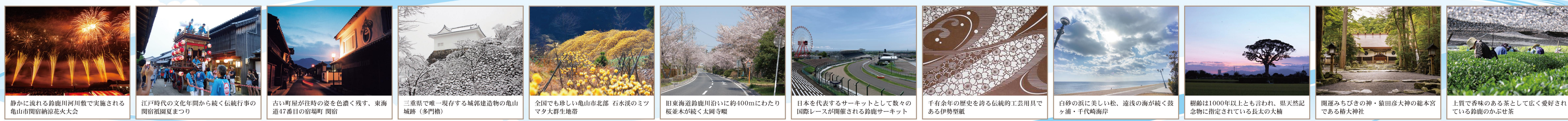
鈴かに流れる鈴鹿川河川敷で実施される亀山市四宿納涼花火大会 江戸時代の文化年間から続く伝統行事の関宿祇園夏まつり 古い町屋が往時の姿を色濃く残す、東海道47番目の宿場町 関宿 三重県で唯一現存する城郭建造物の亀山城跡(多門櫓) 全国でも珍しい亀山市北部 石水溪のミツマタ大群生地帯 旧東海道鈴鹿川沿いに約400mにわたり板並木が続く太岡寺観 日本を代表するサーキットとして数々の国際レースが開催される鈴鹿サーキット 千有余年の歴史を誇る伝統的工芸用具である伊勢型紙 白砂の浜に美しい松、遠浅の海が続く鼓ヶ浦・千代崎海岸 樹齢は1000年以上とも言われ、県天然記念物に指定されている長太の大楠 開運みちびきの神・猿田彦大神の総本宮である格大神社 上質で香味のある茶として広く愛好されている鈴鹿のかぶせ茶