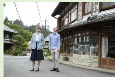
おきつじゅく 奥津宿歴史ガイドと共に散策