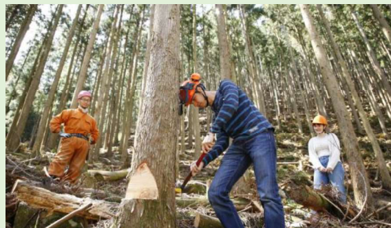
「100年先の森をデザインする」林業体験

苗木を植えてから、木材として利用できるようになるまでには長い年月が必要です。林業は、先人が植えて育てた木を使い、次世代へつなげるために再び木を植える循環型の産業です。