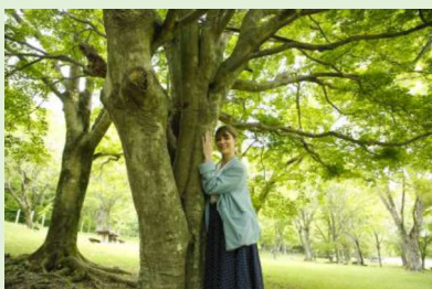
森林セラピー体験