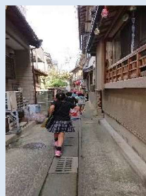
とうし 答志ビンゴゲーム