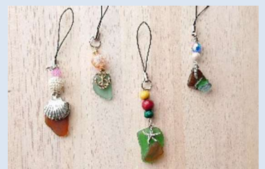
シーグラスアクセサリ