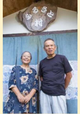
体験民宿オーナーご夫妻

森林と川・海が共存する大紀町では、自然を活かした様々な産業（例：農林漁業、商業、観光業など）が存在し、移住してきた人たちも活躍できる環境があります。