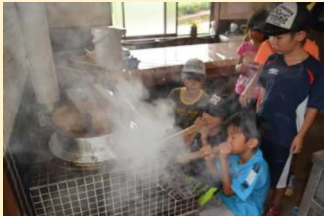
体験民宿 釜戸でご飯作り