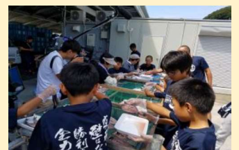
漁業体験 ひものづく 干物作り