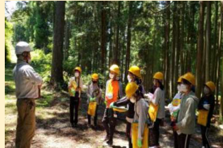
森林体験 森林学習