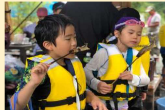
川体験 アユツーリズム