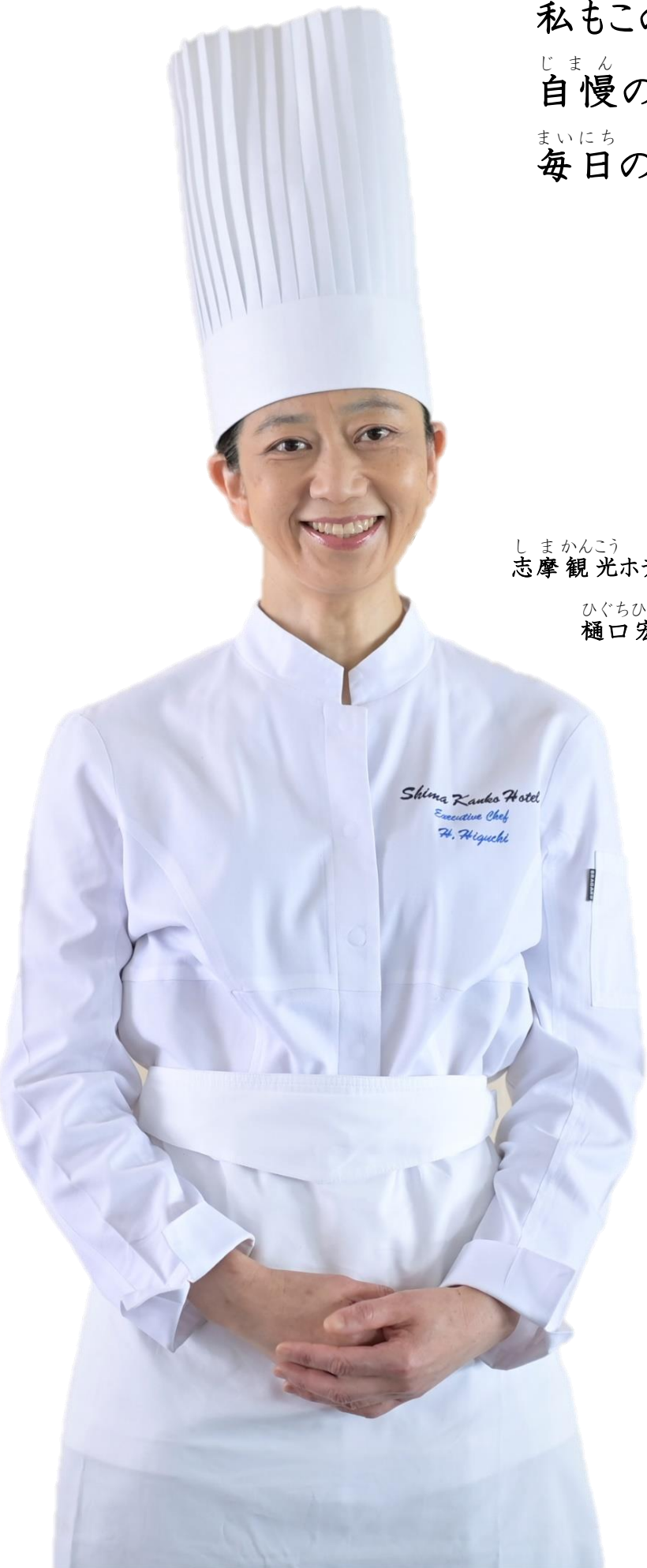
しまかんこう そりょうりちやう 志摩観光ホテル総料理長