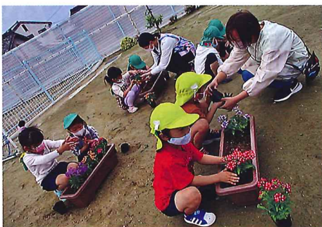
春期緑化運動 (津市 芸濃こども園)