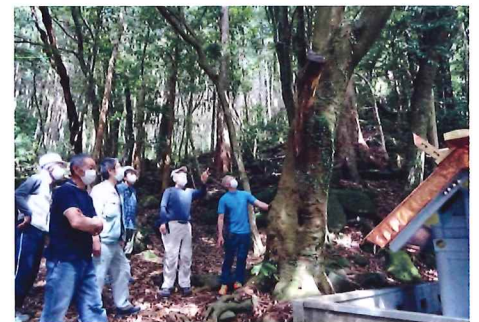
樹木健康診断 (尾鷲市 名柄八幡神社)