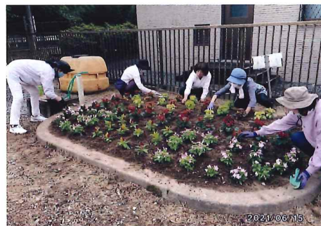
緑の募金交付事業 (多気町 相鹿瀬グリーンチーム)