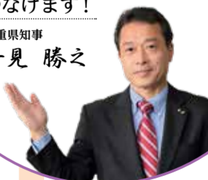
三重県知事 一見 勝之

魅力あふれる県産品を 全国にPRするとともに、 優れた県産品を新たに 掘り起こし、販路拡大に つなげます!