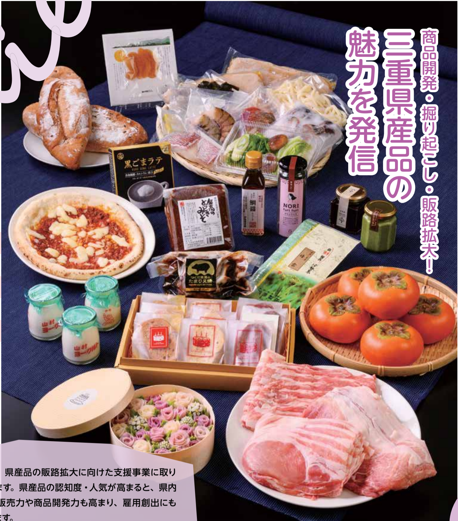
令和4年度 みえの食セレクション選定品

県では、県産品の販路拡大に向けた支援事業に取り組んでいます。県産品の認知度・人気が高まると、県内事業者の販売力や商品開発力も高まり、雇用創出にもつながります。