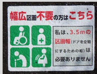
簡易路面標示シート

物品には以下のような、幅広区画が不要な方を誘導する案内があります。なお、デザインは変更となる場合があります。