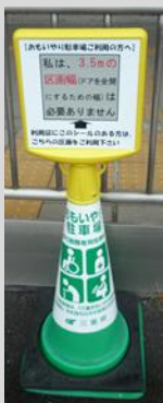
コーンとサイントップ

通常区画をご登録いただける場合、通常区画(幅 2.5m 程度)用の下記の表示用物品いずれかをお渡しします。(数に限りがありますので品切れの場合はご容赦ください。表示用物品のお渡しは原則 1 施設 1 回のみです。破損等による交換の場合は通常お渡しするステッカーのみとなります。)