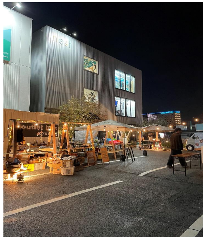
外部で使用する什器 並べるととても良い雰囲気です。

四日市市日永地区にアパレル・フィギュア・アウトドア・飲食店などが並びエリアがあります。地域活性化を願い、毎月第3金曜日の16時から各店舗や、キッチンカーなどが集まるイベントを開催しており、その中で使用するイベント用の什器を県産木材で製作したものを採用いただいています。