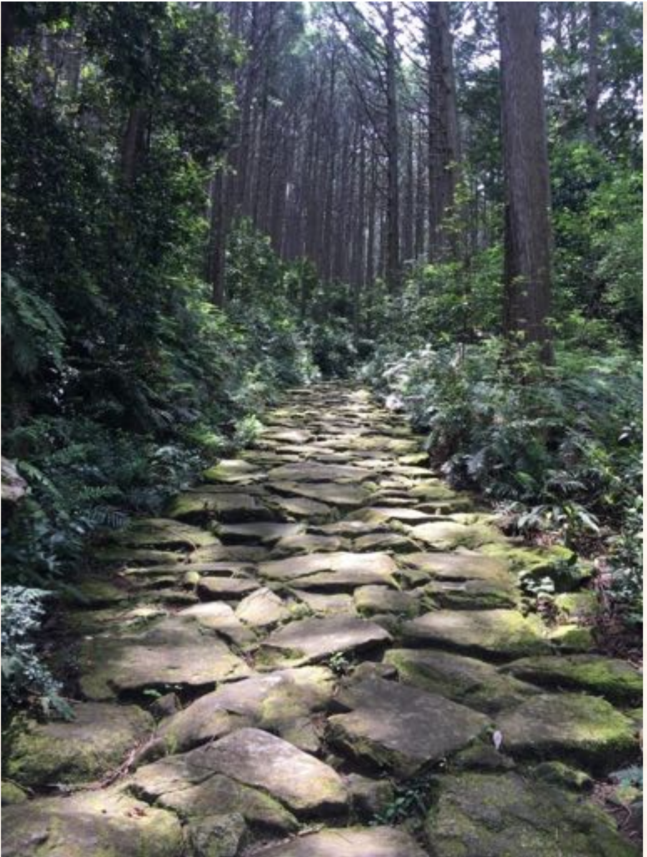
美しい石畳が残る峠道

そんな“伊勢”と“熊野”の二大聖地を結ぶ道「熊野古道伊勢路」をはじめ、東紀州地域のたくさんの魅力を発信するため、公社ではインスタグラムを始めたそうです。