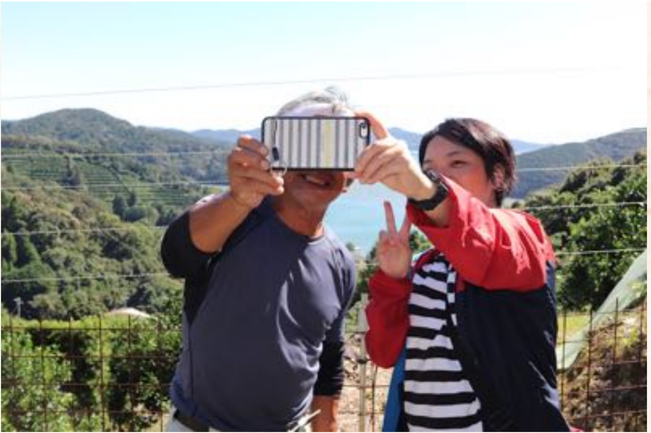
みかん農家さんと遊ぶ某スタッフ。