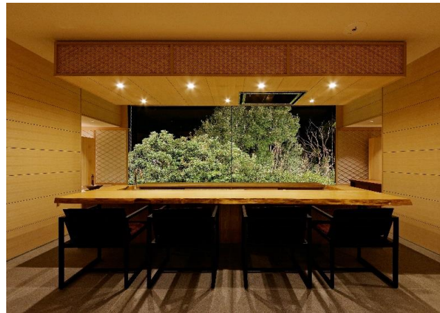
大きな窓の外は常緑樹を眺められ樹木を身近に感じられる