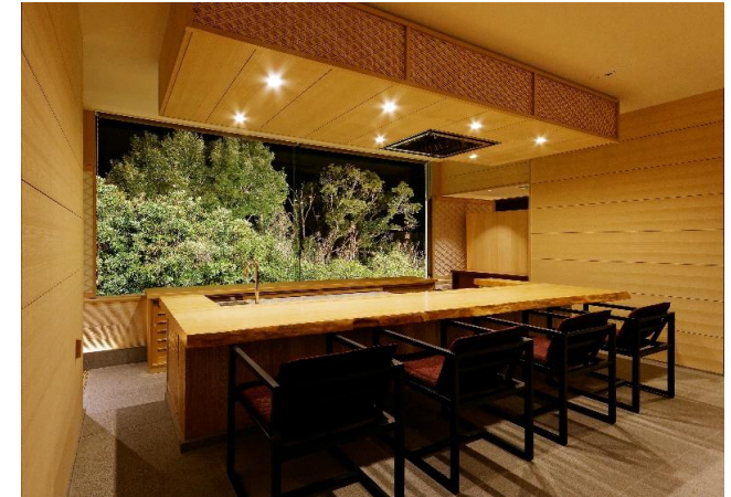
樹齢約250年生のヒノキの一枚板