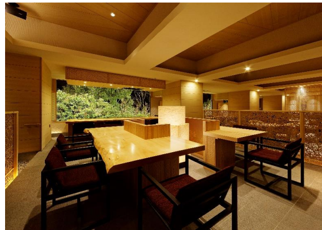
栃の木を使用したテーブル