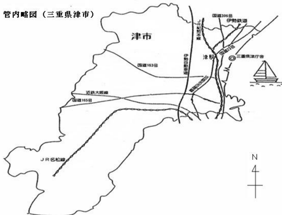
管内略図(三重県津市)

また、380年以上前の寛永年間に始まった「八幡神社祭礼」が起源の津まつりでは、「唐人踊り」「しゃご馬」等の伝統行事が披露されています。