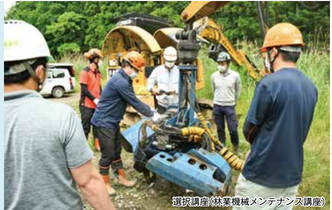
選択講座(林業機械メンテナンス講座)

アカデミーの受講生は、林業・木材産業等で既に働いている方をはじめ、森林資源を活用して起業を目指す方、異業種からの参入・転職を考える方、地域おこし協力隊の方など幅広い方を対象としています。基本コースの受講日数は、年12~21日で、一月あたりでは1~2日程度となるため、働いている方でも受講しやすく、短期間で効率的に学ぶことができます。