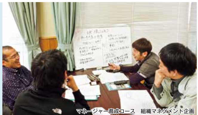
マネージャー育成コース 組織マネジメント企画

アカデミーを介して、講師や受講生など、さまざまな人とのネットワークづくりができます。また、受講日以外や受講修了後であっても、各種相談や講師との取次ぎ、資料の貸し出しなども行えます。アカデミーで一度学べばアカデミーの一員です!