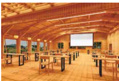
完成イメージ (大教室)