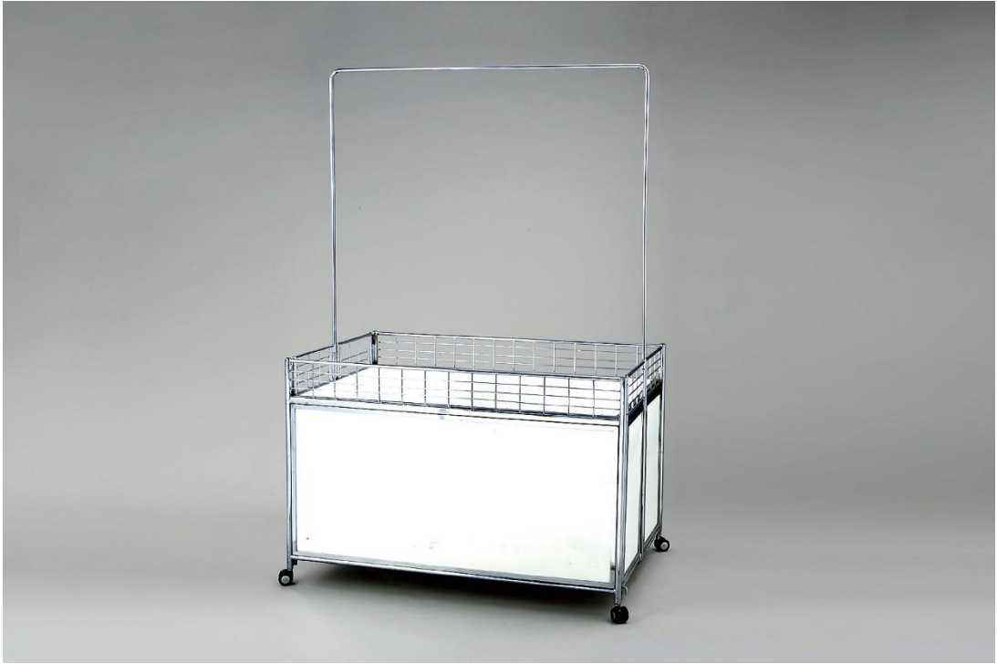
※販売ワゴンイメージ