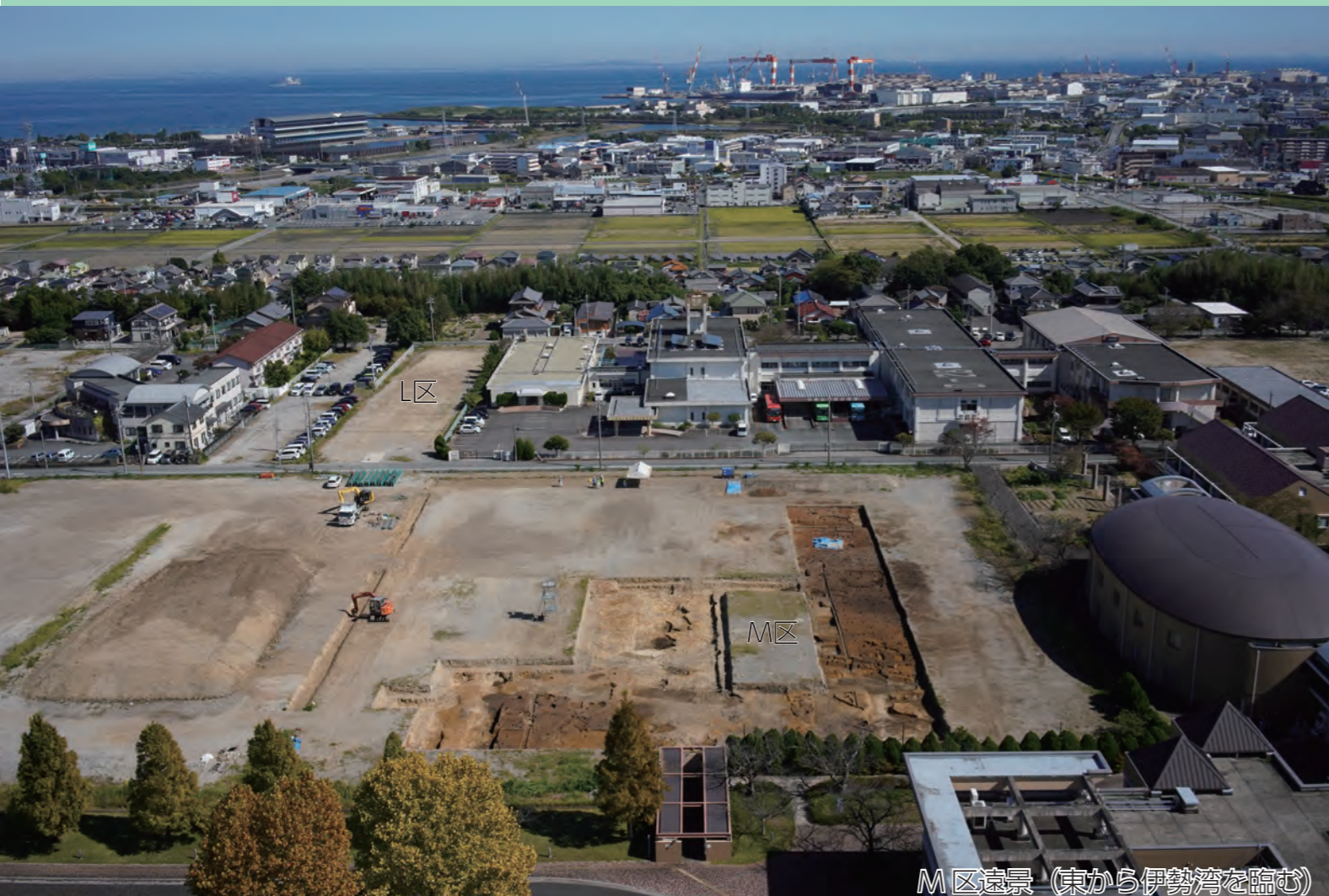
M区遠景（東から伊勢湾を臨む）