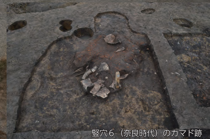
竪穴6（奈良時代）のカマド跡

奈良時代以外の掘立柱建物の時代については、柱穴の遺物の量が少なく、今後も時期を判断する作業をおこなっています。