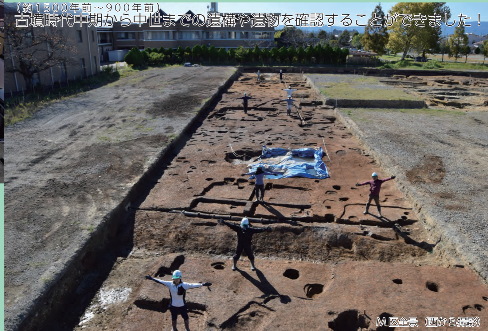
M区全景（西から撮影）

（約1500年前～900年前） 古墳時代中期から中世までの遺構や遺物を確認することができました！