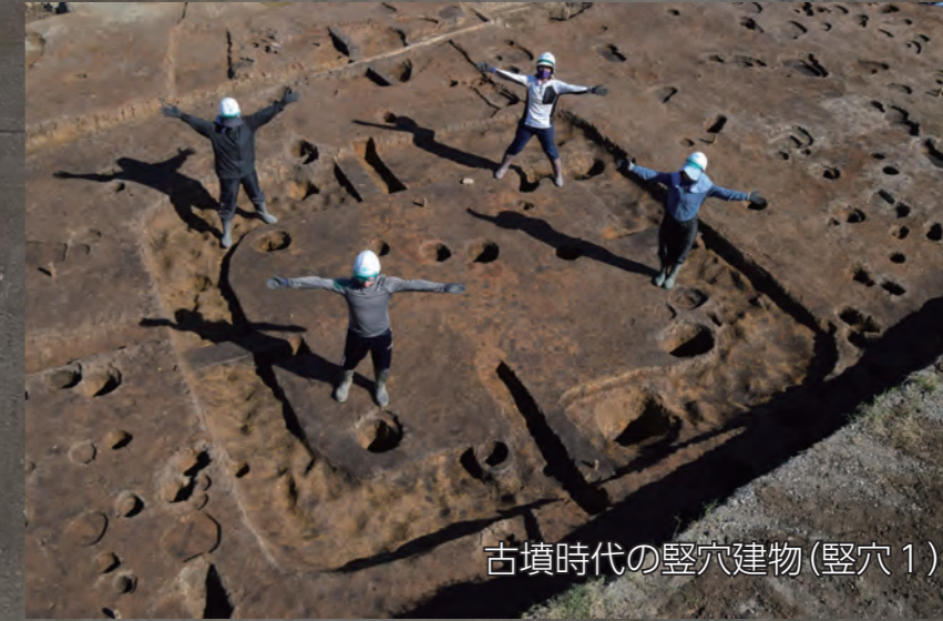
古墳時代の竪穴建物（竪穴1）