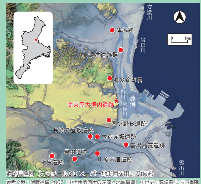
遺跡位置図（カシミール3Dスーパー地形図を用いて作成） 参考文献：伊藤裕博 2007『中世伊勢湾岸の湊津と地域構造』中世史研究論叢⑩ 岩田書院