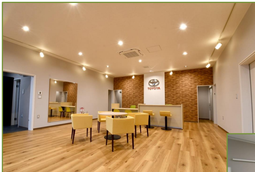
模擬ショールーム