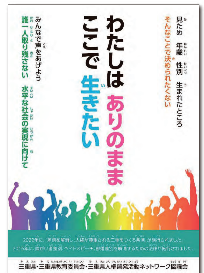
令和4年度人権啓発ポスター

・県内各地で行われる啓発イベントの詳細は、三重県人権センターのホームページをご覧ください。