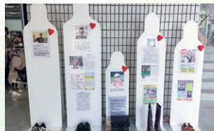
生命のメッセージ展in三重