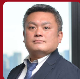
株式会社Suneight 代表取締役