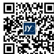
株式会社ジオコス サイト

1964年 愛知県清須市生まれ 1987年 株式会社リクルート入社 1994年 株式会社ジオコス設立 愛知県豊田市 SDGsパートナー 岩手県住田町 大使 愛知県設楽町 地方創生アドバイザー NPO法人愛知ネット（災害救援・市民活動支援）理事 株式会社R4（リクルート代理店）社外取締役 NPO法人夢シート（養護施設支援）理事 ◆書籍「いい会社はどこにある？いい人材はどこにいる？」（PHP研究所） ◆講演 中央省庁、地方自治体、経済団体、企業、大学など全国各地で実施