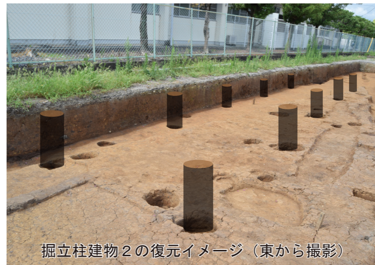
掘立柱建物2の復元イメージ (東から撮影)