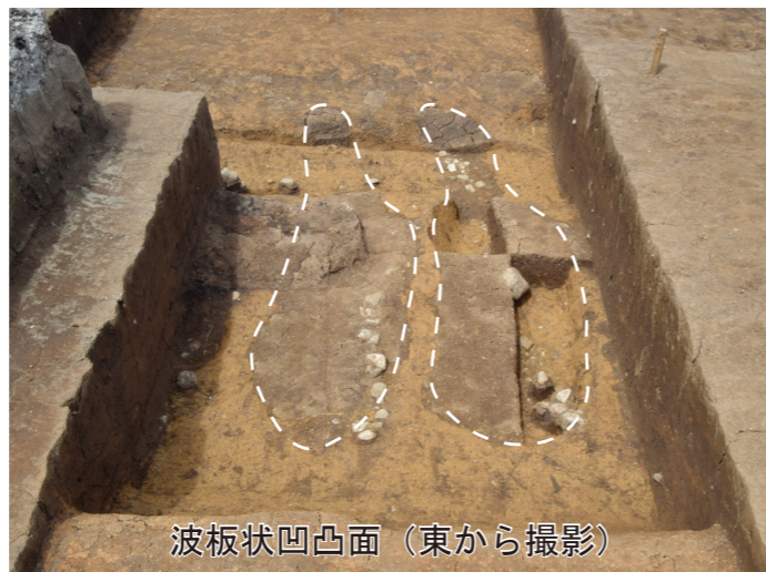
波板状凹凸面 (東から撮影)

A: 今までの遺跡の研究から、道路の跡には楕円形の凹凸面が一定間隔で並ぶ遺構(波板状凹凸面)をとまなうことがわかっています。人や牛馬が歩いた痕跡とする説や、道路をつくる時の基礎工事にとまなうものとする説など、波板状凹凸面の性格に関しては様々な説があります。