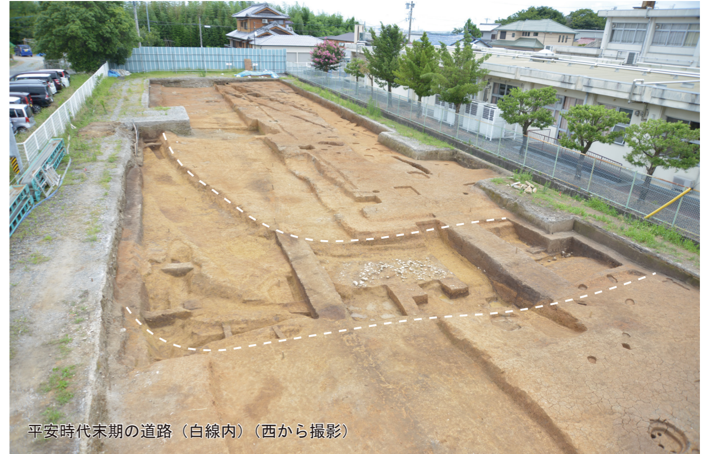
平安時代末期の道路（白線内）（西から撮影）