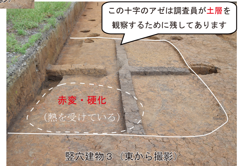
竪穴建物3 (東から撮影)

A: 縄文時代や弥生時代のイメージが強い竪穴住居ですが、実は平安時代に入ってもつくられます。今回の調査でみつかったのは1辺約3mの小型のもので、床面は赤変・硬化しており、熱を受けたことがわかります。住居というよりも作業小屋としての性格が考えられ、竪穴建物と呼称します。