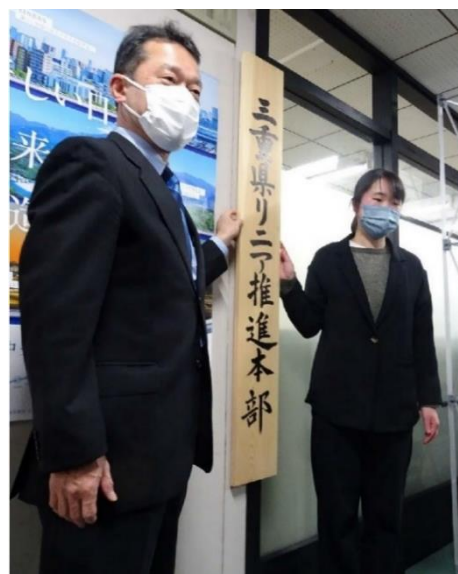
「三重県リニア推進本部」看板