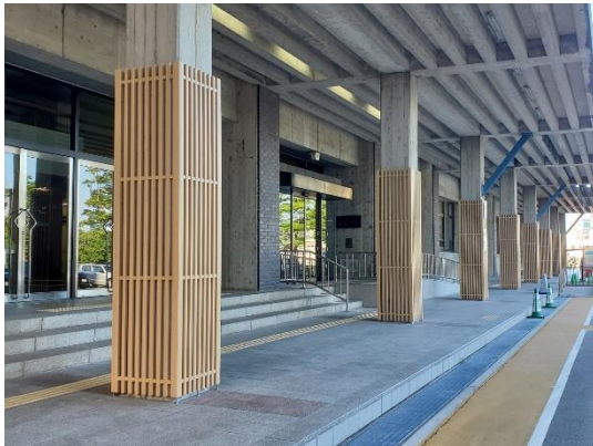
県庁玄関前軒柱の木質化