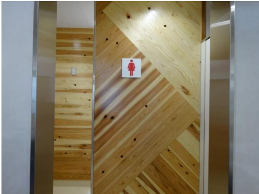
桑名北高校 (トイレ改修) (教育委員会)