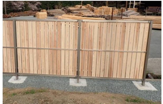
新製品開発支援 (液体ガラスを使用した木塀)