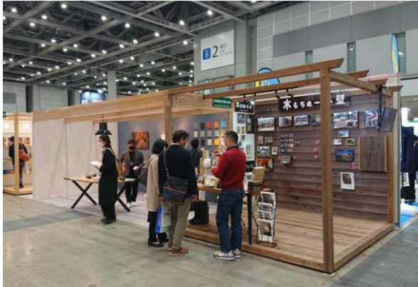
ジャパンホームショー（東京ビッグサイト）