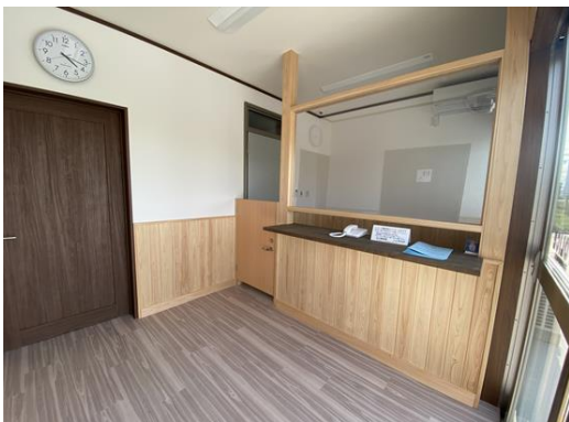
桑名警察署久米警察官駐在所 (警察本部)