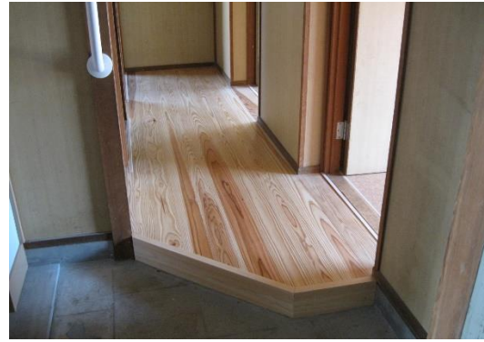
県営住宅白塚団地 (県土整備部)