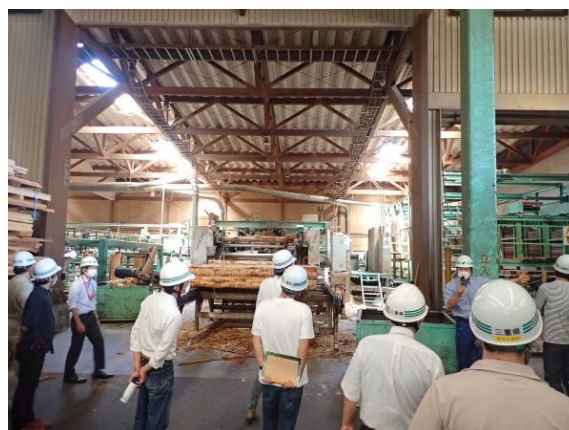
三重県中大規模木造建築設計セミナー