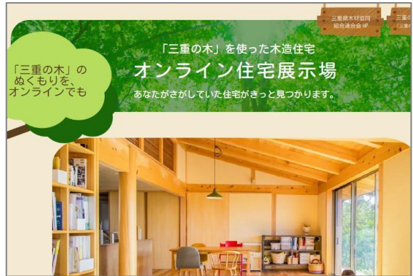
オンライン住宅展示場 (三重県木材組合連合会HP)