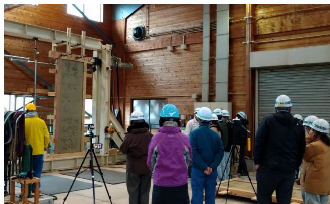
高校生対象の木材利用推進講座 (林業研究所において壁体の耐力試験実施)