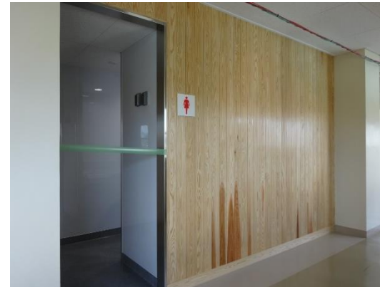
四日市高校 (トイレ改修) (教育委員会)