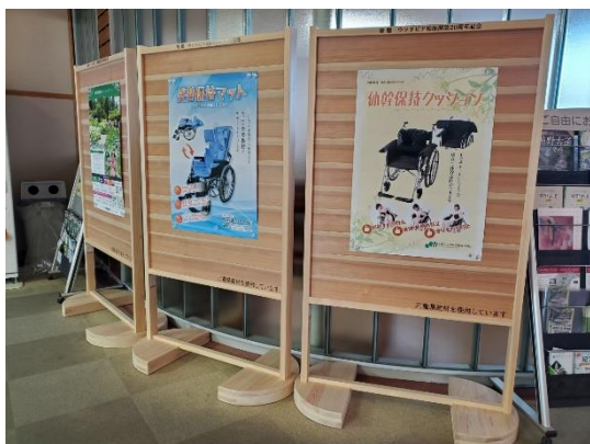
木製掲示板設置 (ウッドピア松阪開設20周年記念寄贈品)