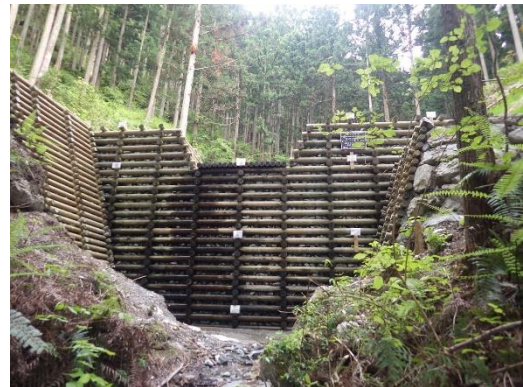
治山ダム工（校倉式）