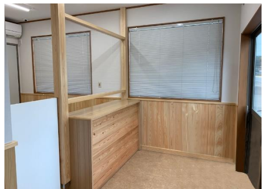
津南警察署川口警察官駐在所 (警察本部)