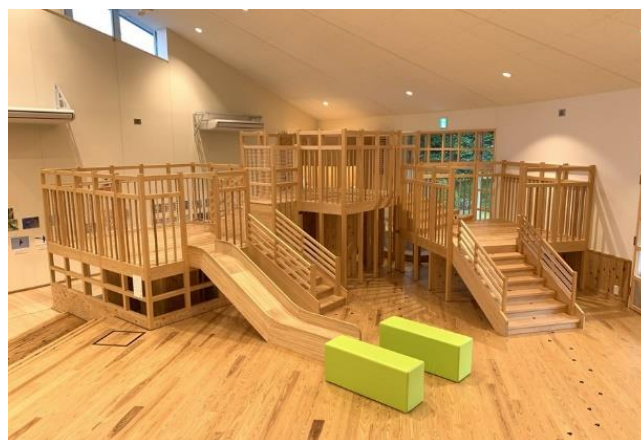
三重県民の森「森林教育ステーション」

森林教育における人材育成については、津市白山町の林業研究所内に設置したみえ森づくりサポートセンターにおいて、森林教育の指導者を育成するための講座を11回開催しました。