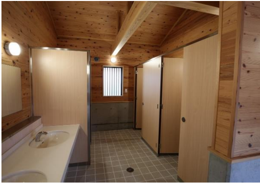
鳥羽阿児線 面白公園公衆トイレ (県土整備部)