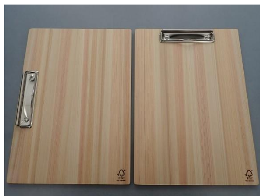
県産材バインダー