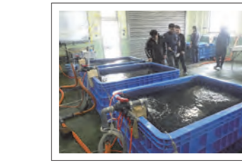
ホシガレイの中間育成(陸上飼育)

左記の各部門の“豊かな海づくり”の活動に永年にわたって貢献し、その功績が顕著であった団体等に対し、大会会長賞、農林水産大臣賞、環境大臣賞、水産庁長官賞を授与し、全国豊かな海づくり大会式典で表彰を行います。