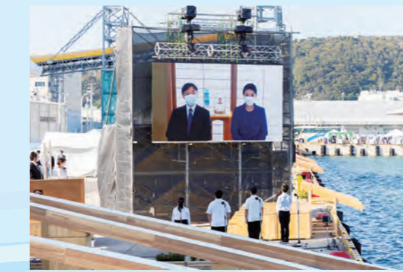
小学生による誓いの言葉