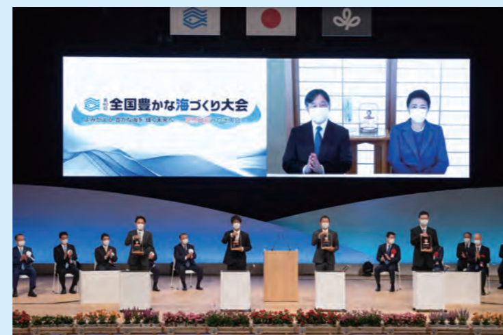
大会記念放流稚魚等の御紹介