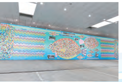
海上歓迎・放流行事会場 おもてなしエリア