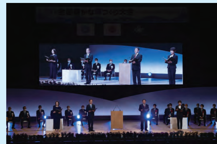
海づくりメッセージ