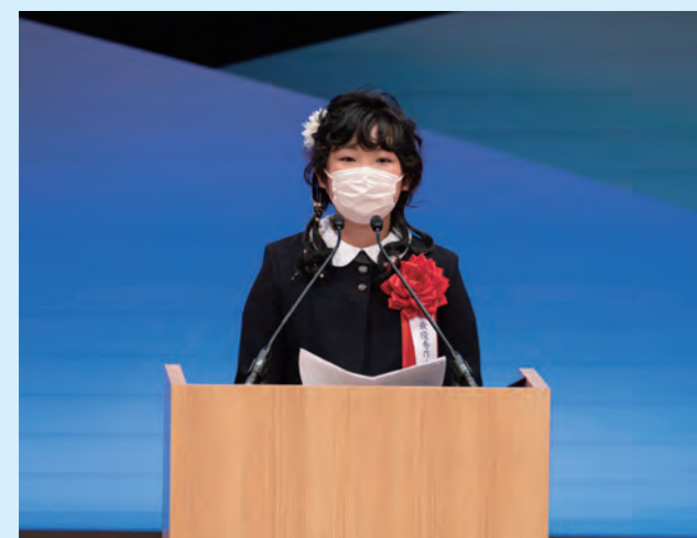
最優秀作文の発表