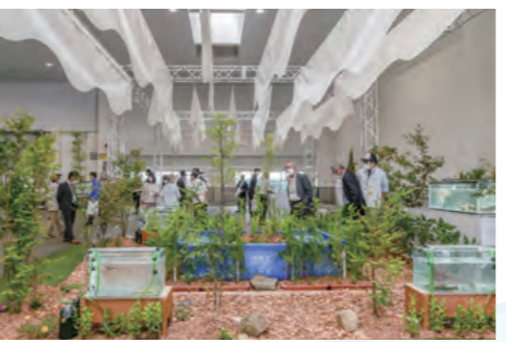
海上歓迎・放流行事会場 おもてなしエリア