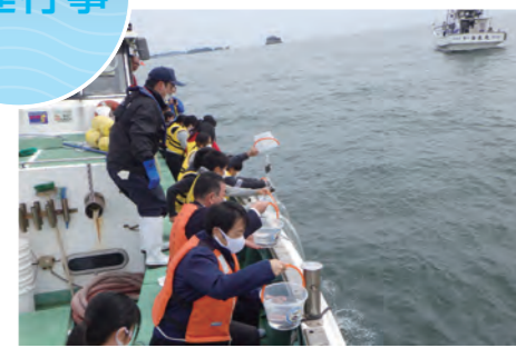
大会関連リレー放流(10月)

主催 豊かな海づくり大会推進委員会、都道府県(大会実行委員会など)の共催等で行われます。 後援 農林水産省 環境省 大会会長 衆議院議長