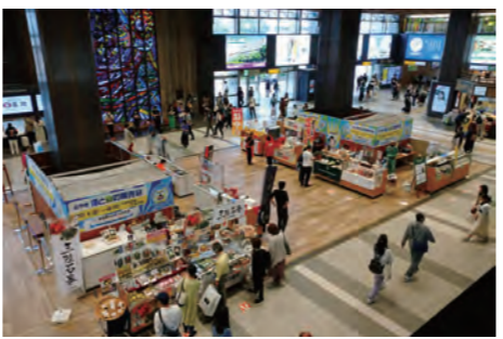
仙台エキナカイベント