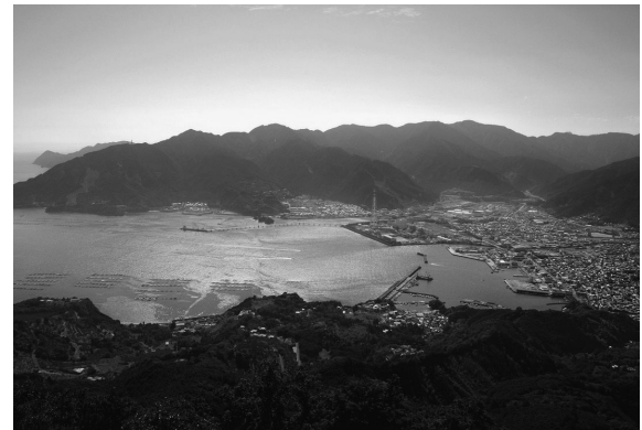
(天狗倉山山頂からの尾鷲の景色)

尾鷲市は、下の写真でもご覧いただけるように山と海に囲まれた街であり、そのため、山の幸と海の幸に恵まれた街であります。山の幸としては、全国有数の多雨地区で厳しい環境で育つ尾鷲ヒノキは強度が大きいことで知られております。海の幸としては、新鮮な魚と種類が豊富な海老類で、尾鷲の市場で揚がった魚介類を提供する店舗を「尾鷲よいとこ定食」として紹介しております。海洋深層水の取水場「アクアステーション」では様々な種類の深層水の提供を行っております。さらに、深層水を利用した商品の開発も行われております。