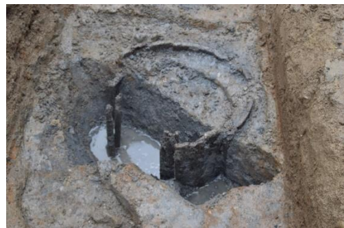
（写真1）瓦や陶磁器を捨てていた穴（南西から）（写真2）桶を井戸枠として利用した井戸（西から）