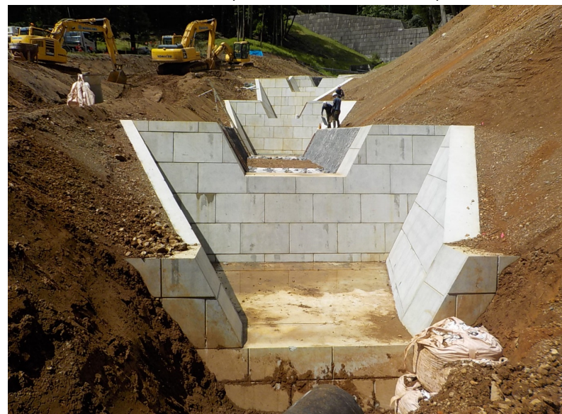
完成 上流側を望む