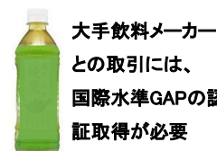
大手飲料メーカーとの取引には、国際水準GAPの認証取得が必要