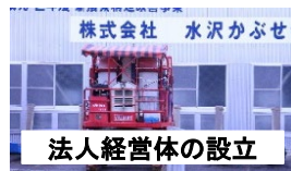
法人経営体の設立