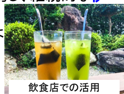
飲食店での活用(伊勢茶ハイ)