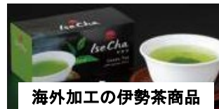
海外加工の伊勢茶商品