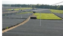
かぶせ茶生産の拡大