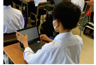
<端末を使用した個別学習>