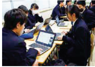
<グループでの共同編集>

また、海外姉妹校とのオンライン交流や各種講演会など、グローバルな視野を身に付ける学習活動にも取り組んでいます。