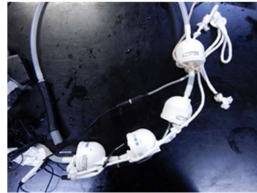
図 1. 深紫外 LED 海水殺菌装置

の注水量で満たした水槽 (容量 3.2L) に個別に収容し、収容後 1 時間ごとに排精、排卵の有無を 8 時間後まで確認した。