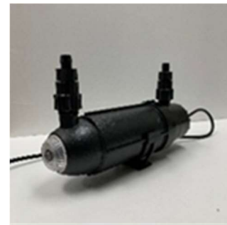
図 2. 紫外線 (水銀ランプ) 海水殺菌装置