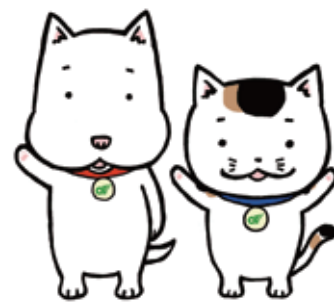
き〜ぼう つむぎちゃん 「あすまいる」のマスコットキャラクター