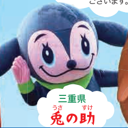
三重県 うさぎの助