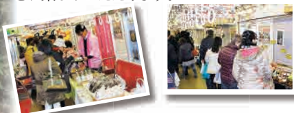
◎「上本町 駅ナカマルシェ」は近畿日本鉄道(株)による販売イベントとなります。※写真はイメージです。

人気の「観光列車 つどい」が「大阪上本町駅」のホームに停車。三重を訪れた気分でお買物をお楽しみいただけます。