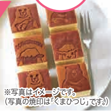
※写真は必ず一箱です。(写真の焼き印は「くまのつし」です。)

羊のカスティージャ(プレーン/キューブ) 1箱(6切入) 【限定数50】1,461円