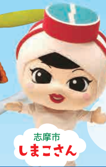
志摩市 しまこさん