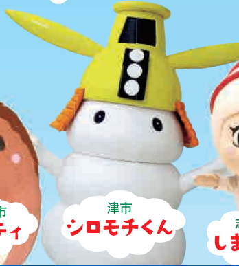
津市 シロモチくん