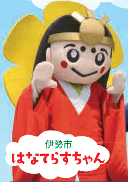
伊勢市 はなまつさちゃん