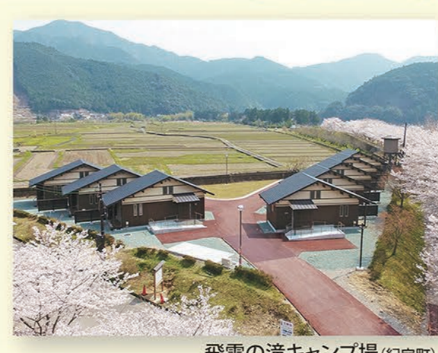
飛雪の滝キャンプ場(紀宝町)