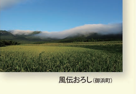
風伝おろし(御浜町)