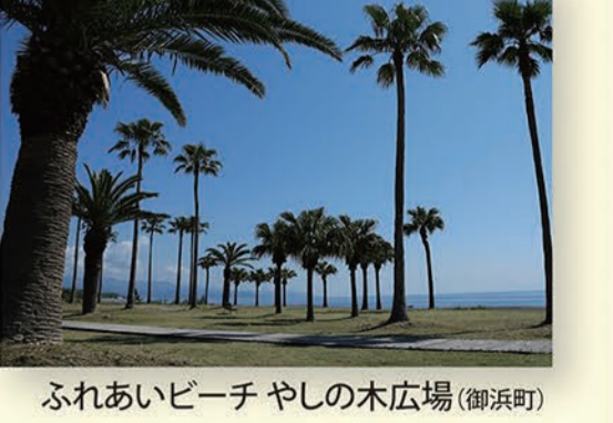
ふれあいビーチやしの木広場(御浜町)