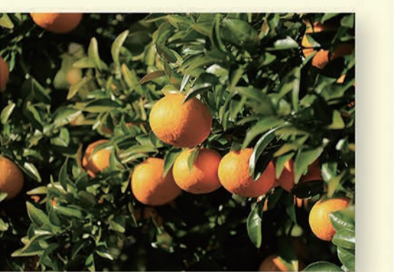
たわわに実ったみかん(御浜町)