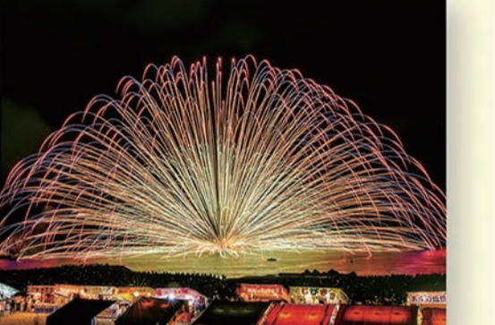
熊野大花火大会(熊野市)