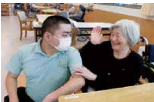
▲障がいのあるスタッフも活躍中