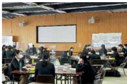
▲職歴や役職に応じ、多様なテーマのキャリア開発研修を実施。