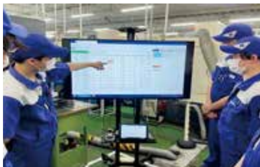
▲設備ごとの生産状況をリアルタイムで確認できるモニタリングシステム。