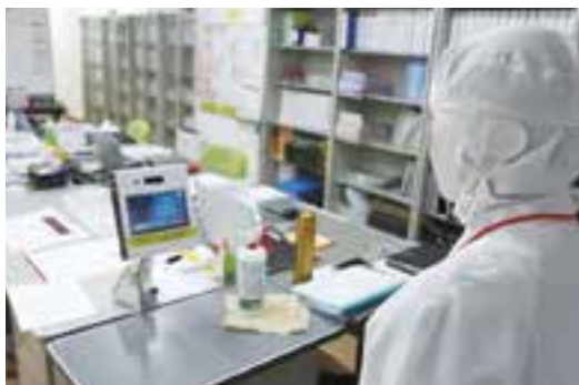
▲DXプロジェクト (顔認証システム導入)