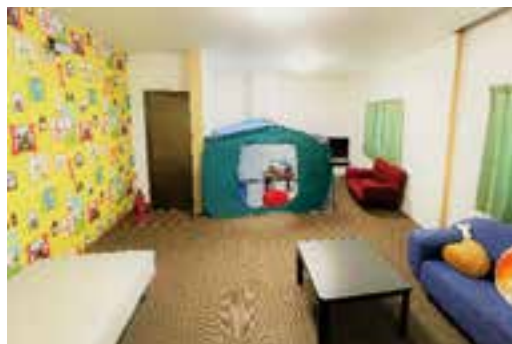
▲社屋を災害時の避難場所として整備。平時は防災グッズを展示。