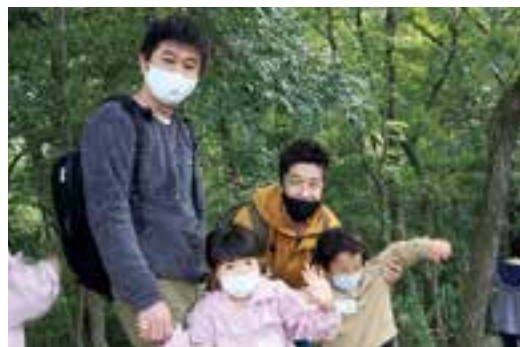
▲アズキキングの森 (親子環境学習イベント)