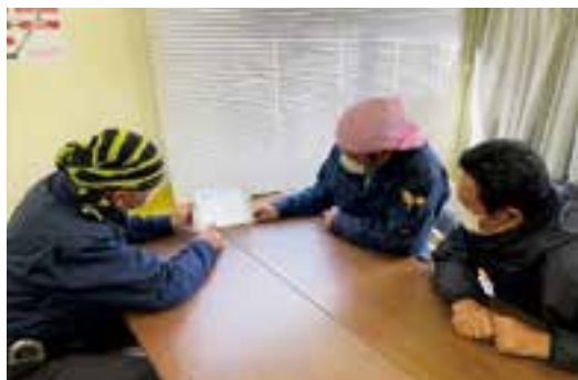
▲10年前から現場職長へタブレット端末を支給。工事予定報告などに活用。