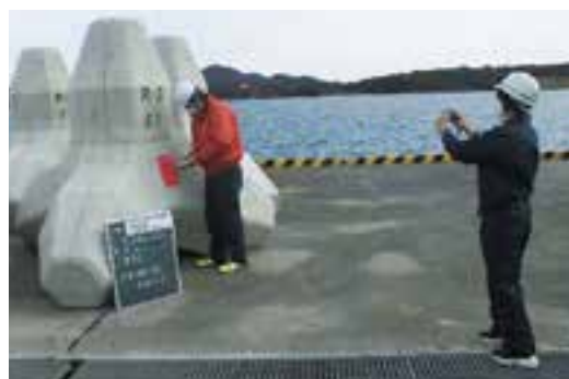
▲建設部門で女性技術職が活躍