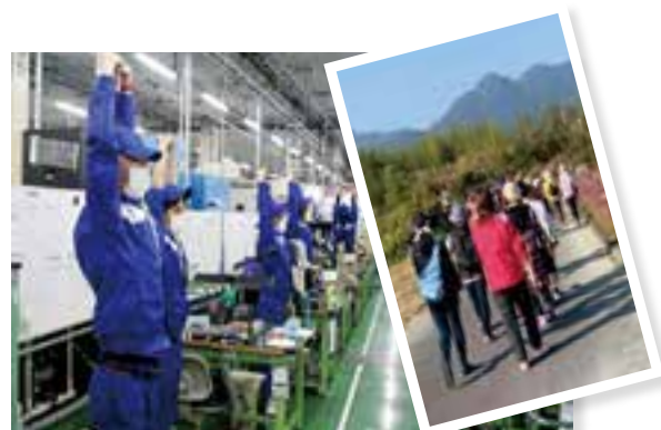
▲経済産業省による「健康経営優良法人」に6年連続認定。さらに、上位500社の「ブライツ500」にも認定。