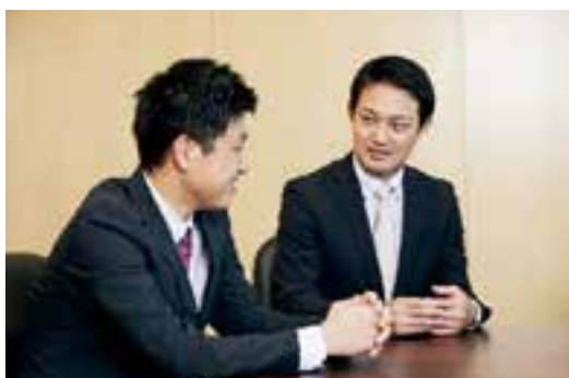
▲1 on1 ミーティングをはじめとしたコミュニケーションに注力。