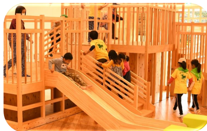
三重県民の森にオープンした「みえ森林教育ステーション」 (県事業：森を育む人づくり推進事業)

未就学児や児童生徒をはじめ、様々な県民に森林や木材について学び・ふれあう場を提供し、森と県民との関係を深める対策を進めます。