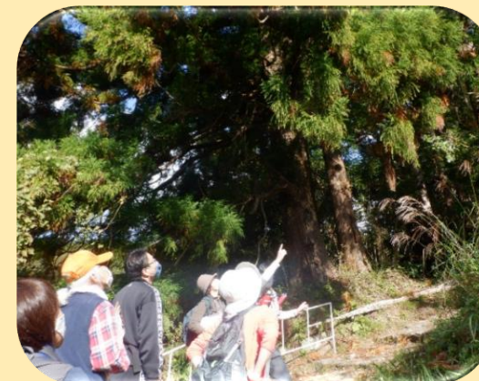
森林環境教育指導者養成講座（技術編）