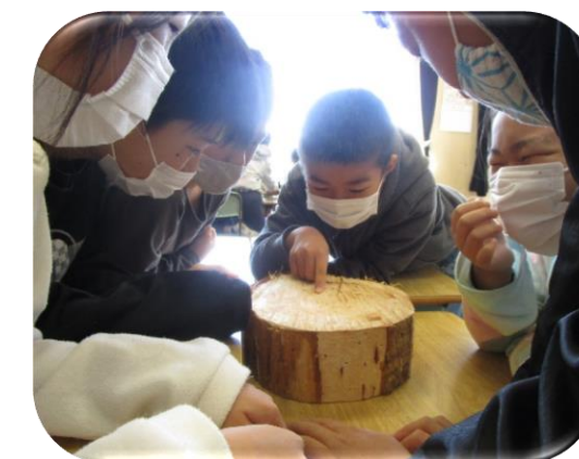
小学校等における森林教育 (玉城町：森林環境教育・木育事業)