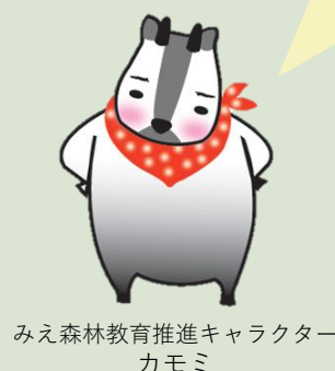
みえ森林教育推進キャラクター カモミ

県では、平成26年度に「みえ森と緑の県民税」を導入し、「災害に強い森林づくり」等に取り組んできました。近年の大型化した台風や頻発する豪雨災害をふまえると、県民の安全・安心な暮らしを守るためには、防災・減災対策を充実・強化することが最優先課題であると考えています。