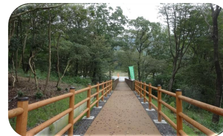
森林公園の歩道などの整備 (菟野町：菟野富士ふるさとの山環境整備事業)

地域の身近な水や緑の環境づくりを進めるため、森・川・海のつながりを意識した森林や緑、水辺環境を守り、生物多様性を保全する活動への支援や、森林や緑と親しむための環境整備等、身近な緑や水辺の環境と県民との関係を深める対策を進めます。