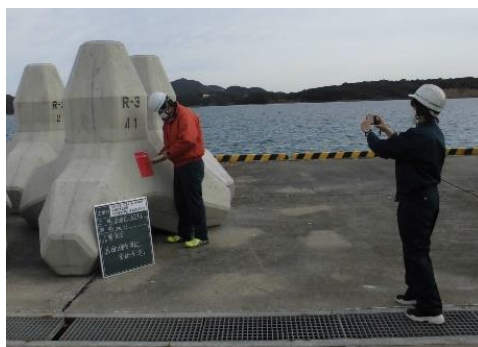
建設部門で女性技術職が活躍