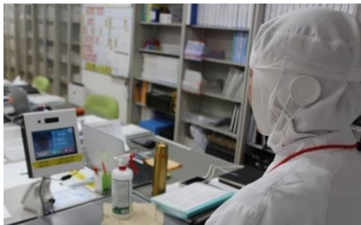
DXプロジェクト (顔認証システム導入)

○DXプロジェクトとして、テーマごとに3つの業務改善チームを立ち上げた。各チームが中心となり、情報のクラウド化や働き方改革に取り組んでいる。