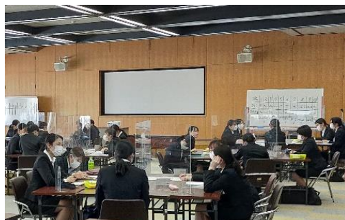
職歴や役職に応じ、多様なテーマのキャリア開発研修を実施。