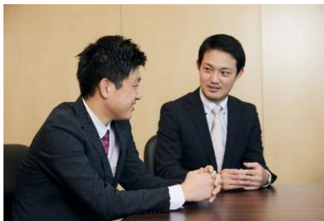
1on1ミーティングをはじめとしたコミュニケーションに注力。