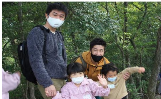
アズキキングの森 (親子環境学習イベント)