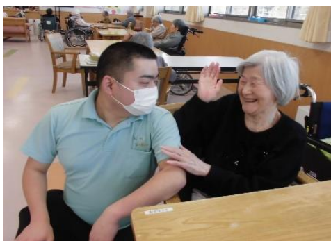
障がいのあるスタッフも活躍中