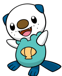
みえ応援ポケモン ミジュール

豊かな自然や食、歴史・文化など、観光資源に恵まれた三重県には、魅力的な観光スポットがたくさん。県では、皆さんに安全・安心に楽しんでいただくための観光地づくりに取り組んでいます。三重の旅を存分にお楽しみください。