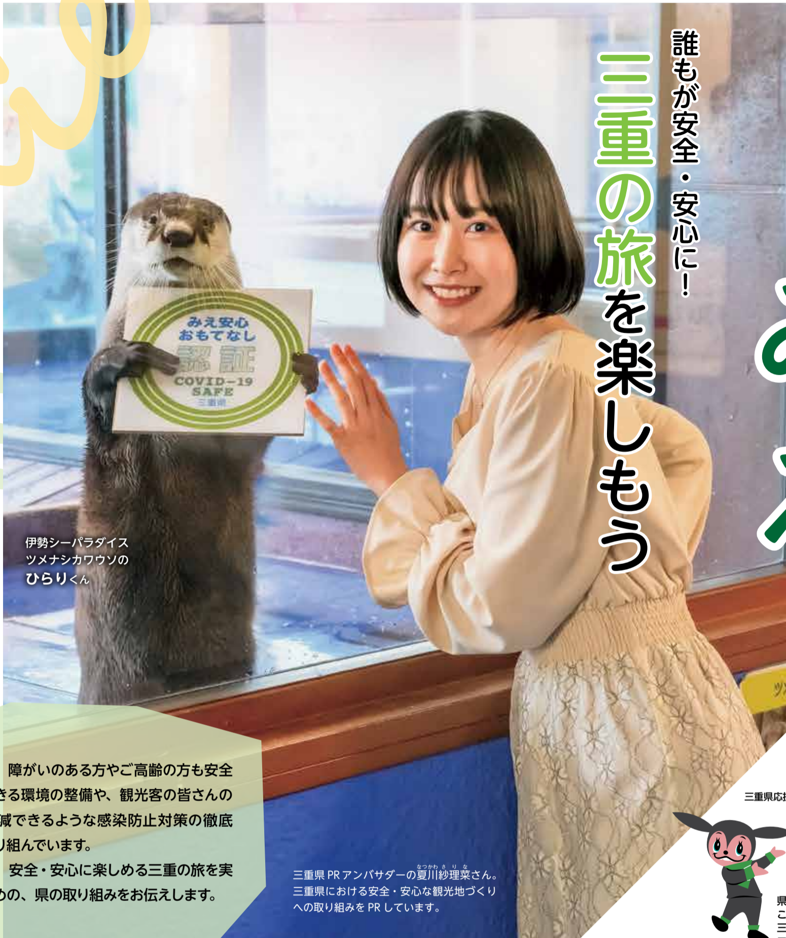
伊勢シーパラダイス ツメナシカワウソの ひらりくん