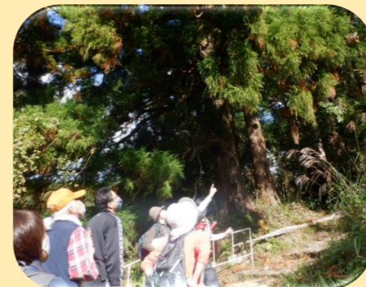
森林環境教育指導者養成講座（技術編）