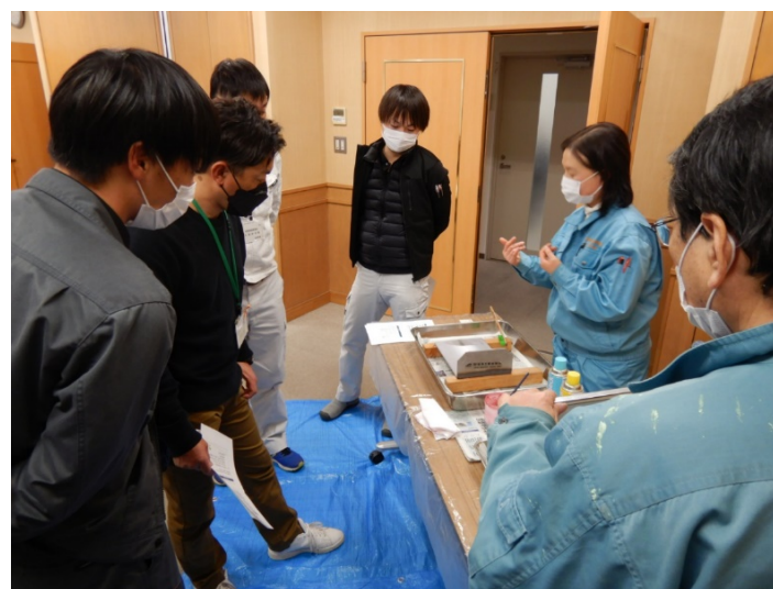
非破壊検査のデモンストレーション