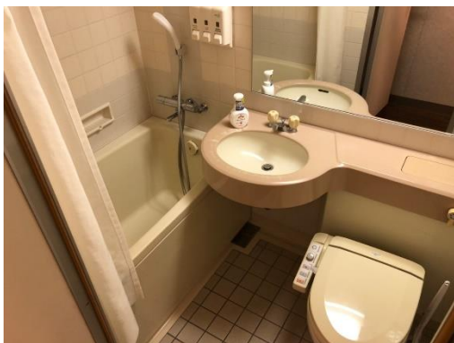
Toilet and bath