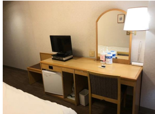
Khu vực bàn