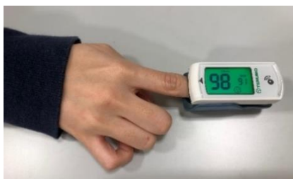
←Máy đo oxy xung ngón tay (Máy đo oxy)

Lúc 10h sáng, y tá sẽ gọi điện, hãy thông báo tình trạng sức khỏe cho y tá.