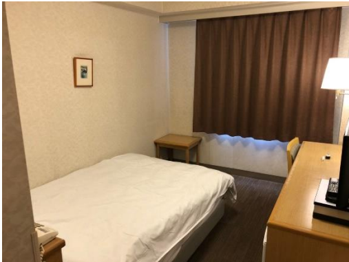
Toàn cảnh trong phòng