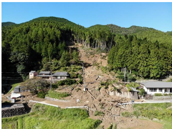
(地すべり発生直後)