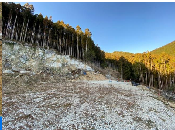
(倒木除去実施状況)