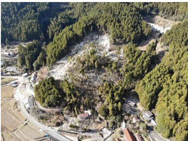
(倒木除去工実施前)