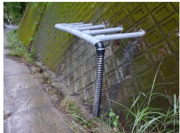
(ボーリング暗渠工)