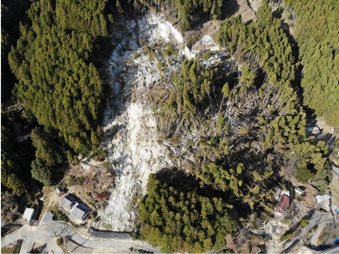
(種子吹付工実施状況)