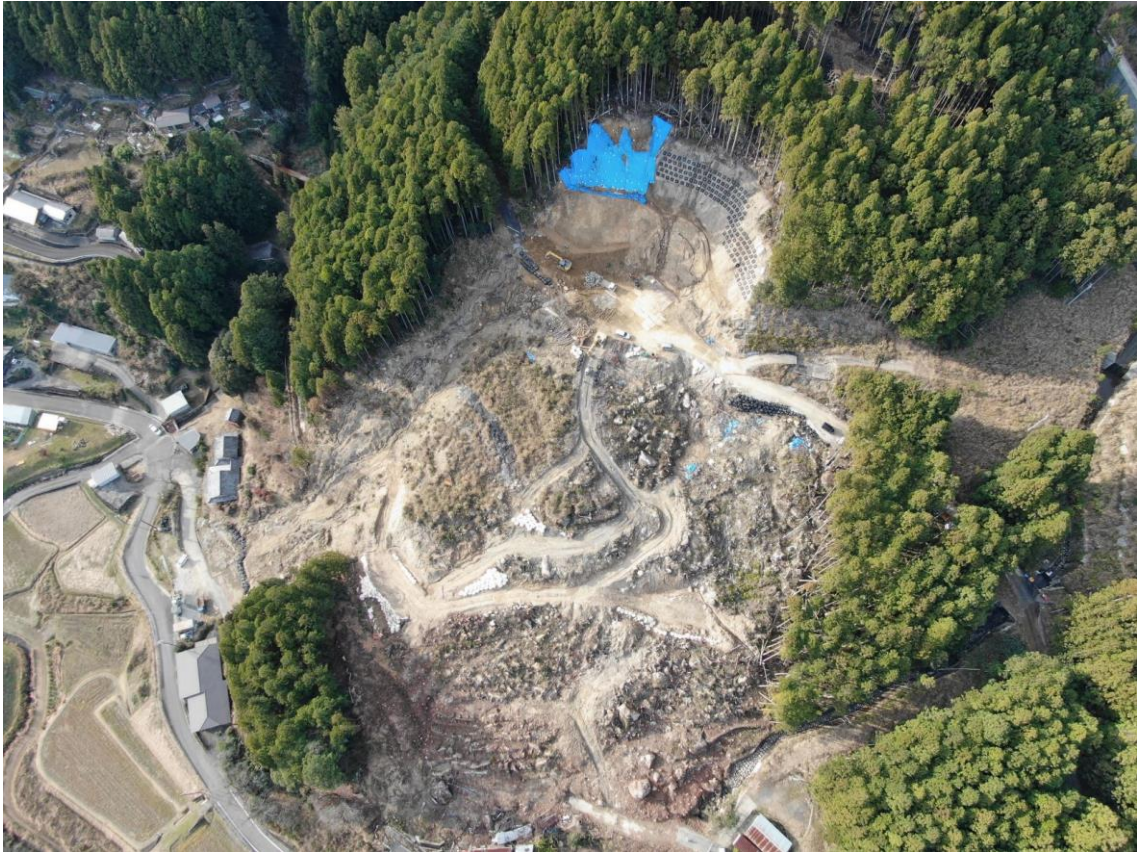
(倒木除去実施状況)