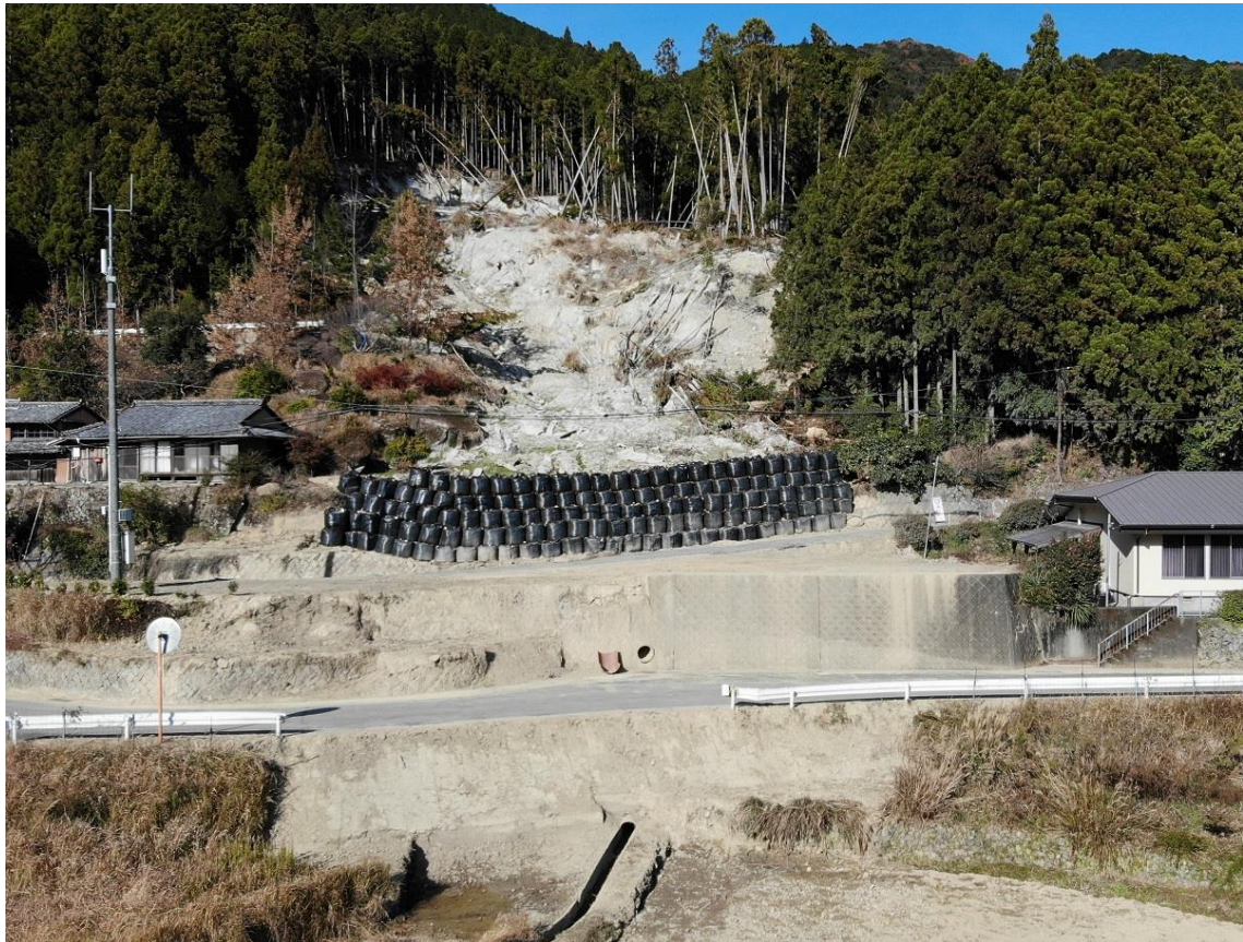
(応急工事実施状況)