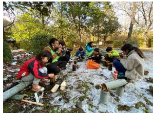
プログラム実践の様子

森林をフィールドに、子どもたちが仲間とともに活動し、主体的に学ぶことができるプログラムの展開やプログラムを実践する指導者の養成等に取り組んでいます。