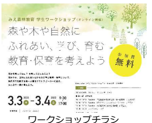
ワークショップチラシ

将来、教育・保育の現場に携わろうとする大学生・短大生等を対象としたワークショップの実施などにも取り組んでいます。