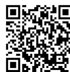
三重県パートナーシップ宣誓制度HP