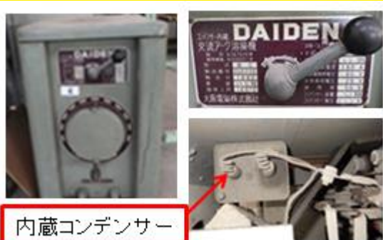
内蔵コンデンサー