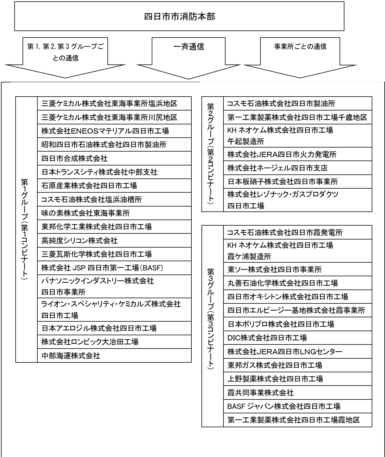
四日市臨海地区 MCA 無線系統図