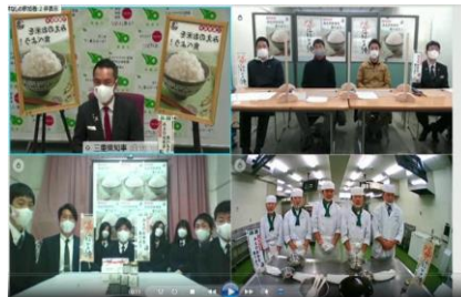
知事、生産者、高校生によるおむすび対談

産地間の競争が激化している中、県産米の消費拡大に向け、今後も県産米の販売推進活動を展開していきます。