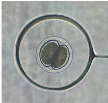
高品質な卵子から生産される受精卵

そこで、性ホルモンを補うホルモン処置方法を改良するとともに、ウシ卵巣内から卵子を取り出す最適な時期を特定することで、高品質な卵子を確保するための条件を見出しました。開発した技術を活用した受精卵は、本年度より県南部地域にて供給を開始しています。