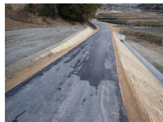
農道2号 完成 (河内広石原線・前田河内広線)