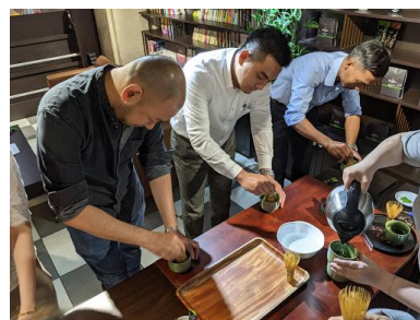
オンラインツアーでの抹茶体験