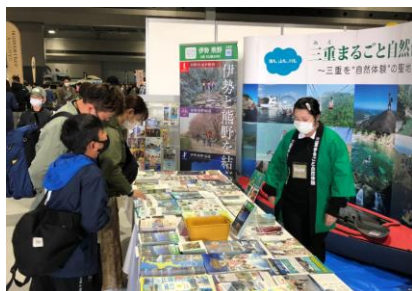
アウトドアイベントでの情報発信