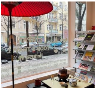
伊勢茶特設ブース (ドイツ日本食材店)

これらの取組を通じて、ターゲット国における伊勢茶の認知度向上を図るとともに、現地の実状に対応しながら、輸出の拡大に取り組んでいきます。