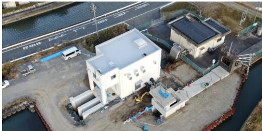
新設機場（左）旧機場（右）