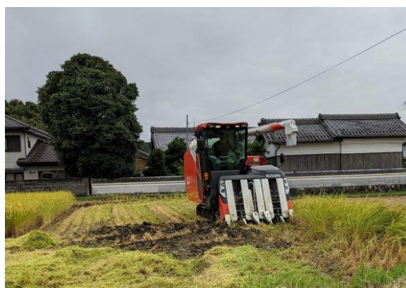
山畑地区の稲刈りの様子

今後も、地域での話し合いを着実に進め、中間管理事業を活用しながら、引き続き担い手への農地集積・集約化の取組が円滑に進むよう、関係機関と連携して取り組みます。