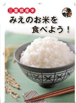
県産米推進ポスター