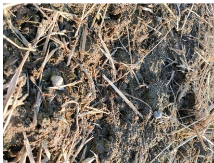
冬期耕うん後のほ場

今後もスクミリンゴガイの被害を抑制するため、体系的な防除（IPM）の実践を推進していきます。