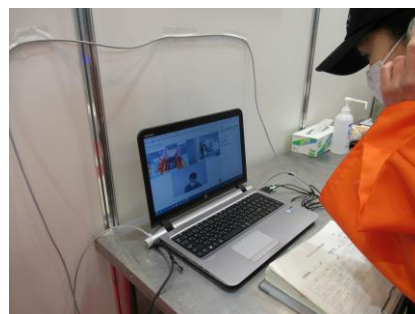
オンラインによる対応の様子