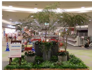
観葉植物等を使用した飾花 (ショッピングモール)