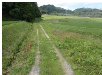
農道2号 着手前 (河内広石原線・前田河内広線)

また、改良された農道は、スムーズな通行が可能となり、災害時の緊急避難道路としても活用が期待されています。