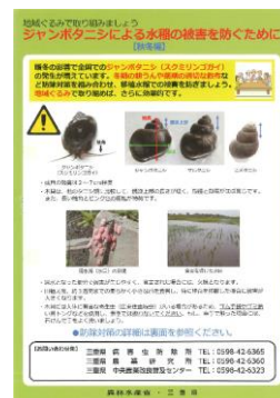
防除対策ポスター