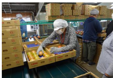
トマト選果作業の様子