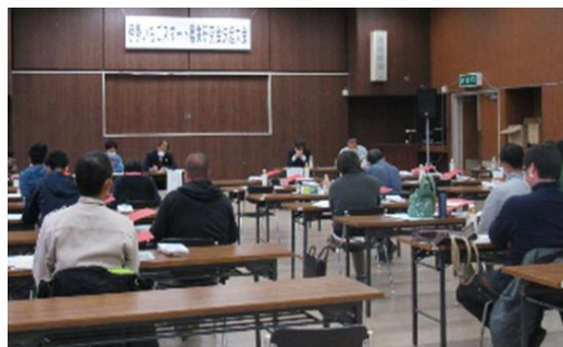
研究会設立総会の様子

普及センターでは、得られたデータの分析に基づいた栽培研修会の開催を通じ、会員の技術向上と、産地全体の経営安定を目指すとともに、次世代のイチゴ生産者の確保に向け活動を進めていきます。