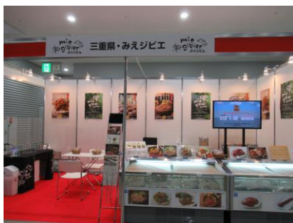
出展ブースの様子

本展示会で得た情報やネットワークを通じて、引き続きみえジビエの販路拡大に取り組めます。