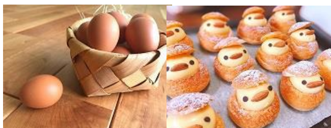
こだわり卵と卵加工品（シュークリーム）