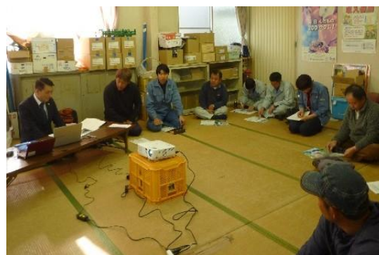
専門家派遣による支援の様子

これらの取組等により、県内の法人経営体は565経営体（前年度比24経営体増）となっています。引き続き、相談所の取組等を通じ、経営体の育成に取り組めます。