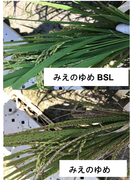
ごま葉枯病検定圃場での発生程度

三重県と農研機構が共同でイネごま葉枯病抵抗性を持つ実用品種の育成に取り組み、世界で初めて抵抗性品種を育成しました。育成した「みえのゆめBSL」は、イネごま葉枯病の発生が多いほ場では「みえのゆめ」よりも約30%多い収量が得られます。令和2年11月9日に品種登録出願し、令和3年2月8日に出願が公表されました（出願番号：第35057号）。令和4年から「みえのゆめ」に代わり、県内での一般栽培が開始される予定です。