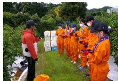
カンキツ収穫作業の様子