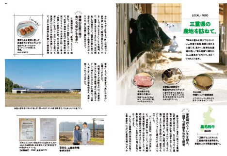
紙面での県内の生産者紹介