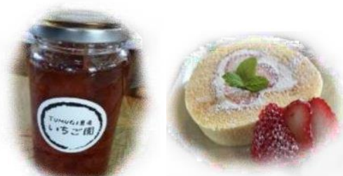
ジャムとロールケーキ