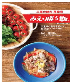
メニューブックの表紙