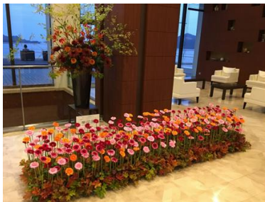
ガーベラを使用した飾花 (鳥羽国際ホテル)

県では、これらの取組への支援をとおして、県産花き花木への関心を高め、消費拡大につなげていきます。