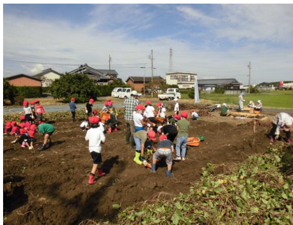
さつまいも収穫体験

農村環境保全活動では、子どもたちに農作物の作付けや収穫作業の体験を通じて、農業の持つさまざまな魅力を発見・体感してもらうことを目的に、有田小学校の1、2年生とともに、サツマイモ収穫体験を実施しています。収穫したサツマイモは、その場で焼き芋にして試食するほか、学校での調理実習等で活用しています。