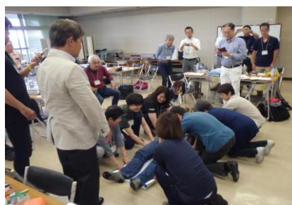
安全管理をテーマとした研修会の開催