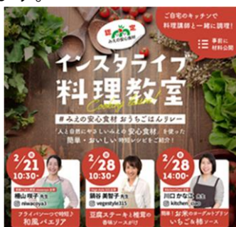
オンライン料理教室のチラシ

引き続き、作成した動画を直売所店頭やSNSにより情報発信するなど、制度周知に取り組んでいきます。