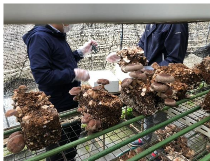
しいたけ収穫体験の様子

今後も作成したプログラムを活用しながら、引き続き若者等への農業就労の促進に取り組んでいきます。