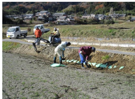
法面の修復作業風景

さらには、地域の活性化を願う地元有志により「棚田展望台」の設置を行うなど、より一体感のある地域の取組も行っています。