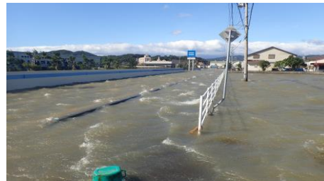
受益地内の湛水状況（平成29年度）