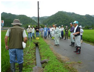
田んぼの生き物調査