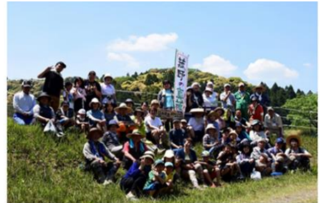
集落一体となった柵設置、緩衝帯整備