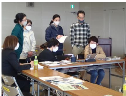
座談会（会場）の様子

そこで、県内の農林漁業体験民宿経営者や市町の移住担当職員が互いに来訪者の受入れに係るノウハウや各市町における移住希望者の動向を共有し、地域の魅力を伝える拠点づくりについて、今後の取組のブラッシュアップにつながるような座談会を開催し、引き続き、移住促進に取り組んでいきます。