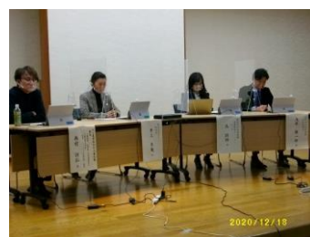
特別公開講座の様子

今後も、MBA養成塾の塾生確保に向けて、PRイベントや公開講座等を通じて、県内外に広く発信していきます。