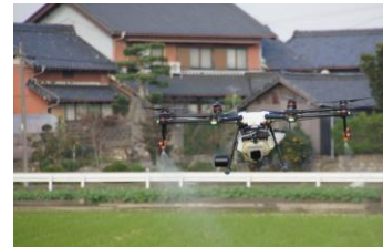
県ブランド米・結びの神 ドローンによる農薬散布