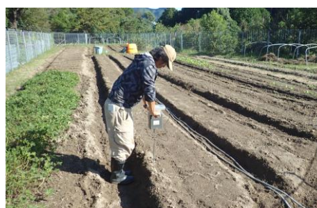
土壌物理性の確認の様子