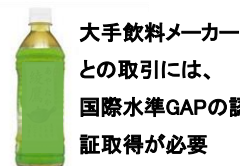
大手飲料メーカーとの取引には、国際水準GAPの認証取得が必要