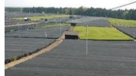
かぶせ茶生産の拡大