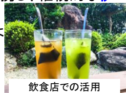
飲食店での活用(伊勢茶ハイ)

・飲食店や観光事業者等との連携による、飲用としての伊勢茶の提供や、伊勢茶を活用した料理、サービスの提供の促進