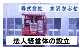
法人経営体の設立