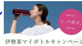
伊勢茶マイボトルキャンペーン