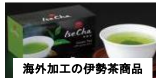
海外加工の伊勢茶商品