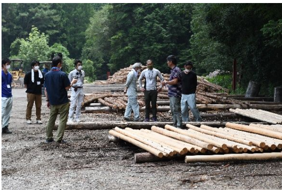
（マネージャー育成コース講座）