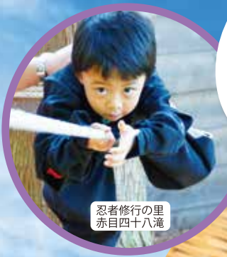
忍者修行の里 赤目四十八滝