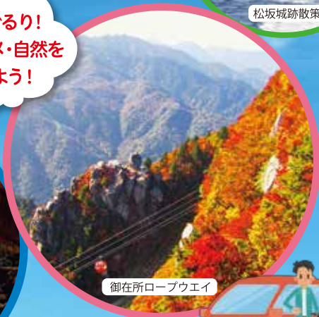
御在所ロープウェイ