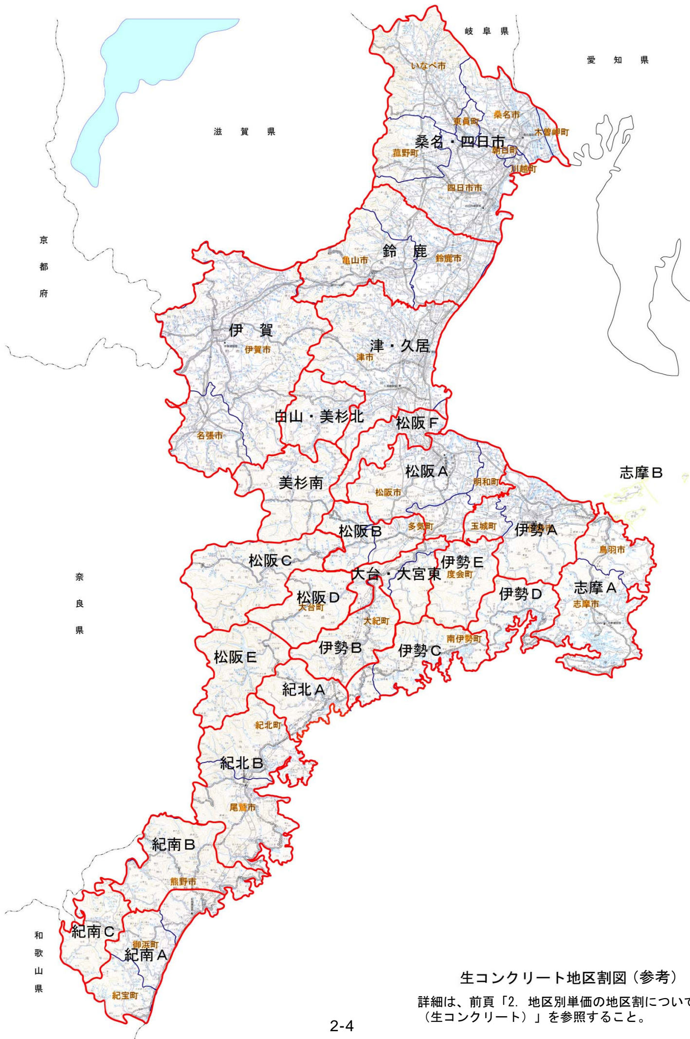
生コンクリート地区割図（参考）

詳細は、前頁「2. 地区別単価の地区割について（生コンクリート）」を参照すること。